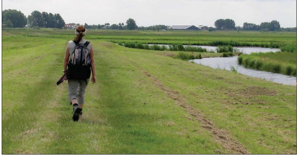
Verderop zijn de recreatiemogelijkheden meer gericht op natuurbeleving: wandelen, kanoën, vogelspotten etc. Er zijn meerdere rondwandelingen mogelijk.