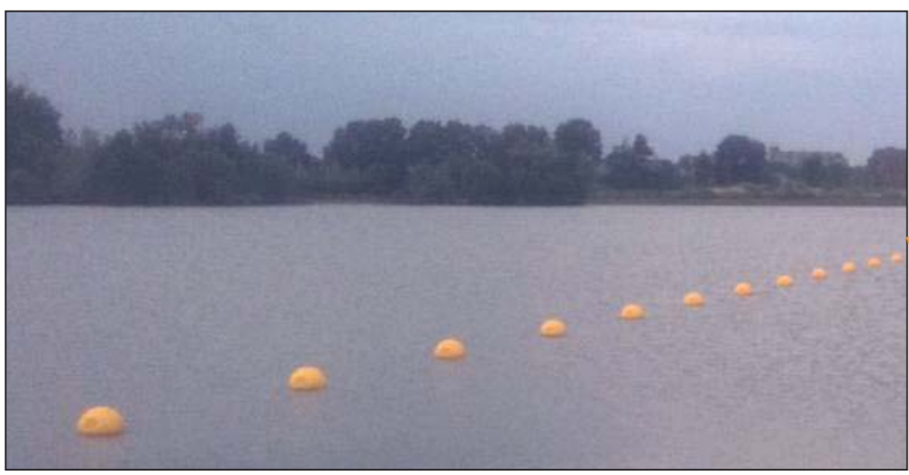
De instroom vanaf de Lek zorgt voor een continue verversing van het water in zowel de natuurplas als de recreatieplas. De instroom is niet toegankelijk voor boten vanaf de Lek.