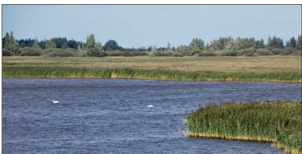
De natuurplas heeft rondom brede natuuroevers met rietzomen, vooroevers, eilandjes. In deze oeverzones vinden tal van vogels een leefgebied. Voor vissen ontstaat er een paaiplaats.