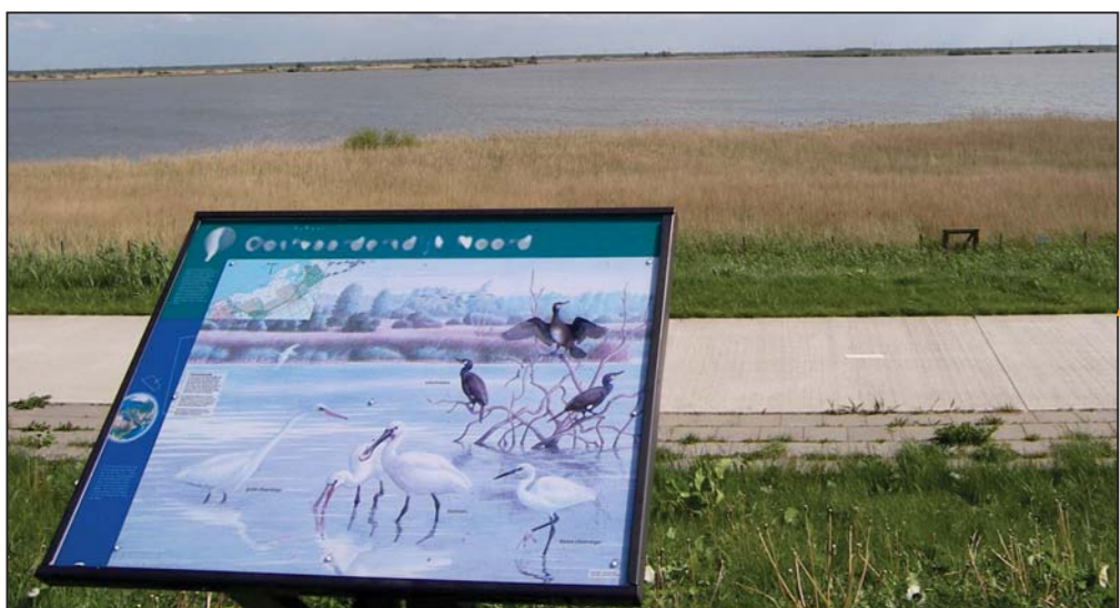
Verschillende paden ontsluiten het gebied voor verschillende doelgroepen. Op enkele plaatsen zijn uitkijkpunten.