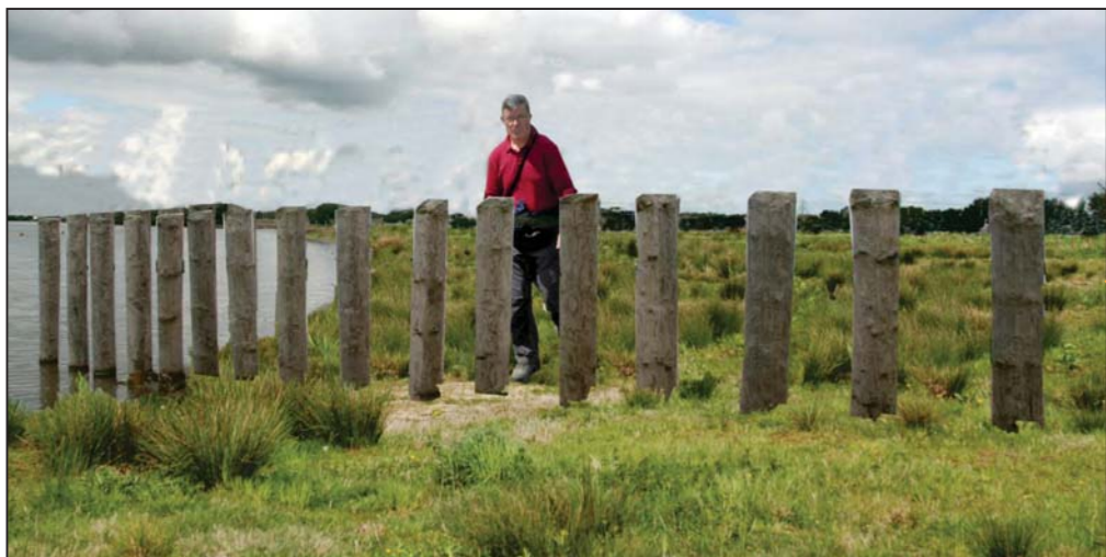
Tussen de natuurplas en de recreatieplas ligt een dam. De dam is alleen toegankelijk voor voetgangers. Een palissade met klaphek houdt fietsers en mountainbikers tegen. De wandelaar kan zowel rondom de recreatieplas als rondom de natuurplas wandelen.