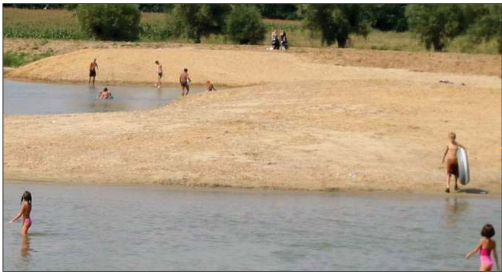
Zandstranden langs de Lek met voldoende parkeerruimte en ligweides. Toiletten en kiosk zijn (in het seizoen) aanwezig.

Duurzame ontwikkeling voor recreatie en natuur